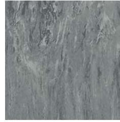
Graphite 9120 w/r 9120 NCS S 4502-G LRV 28 ■ ■ +