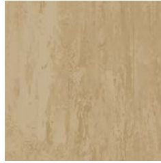
Desert Sand 9180 w/r 9180 NCS S 3020-Y10R LRV 37