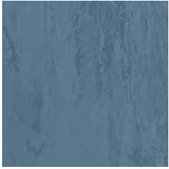
Atlantic Blue 9170 w/r 9170 NCS S 4020-R90B LRV 23