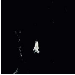
Black Panther 8640 w/r 8640 NCS S 8502-R LRV 6