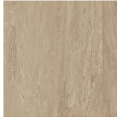
Mushroom 9110 w/r 9110 NCS S 3010-Y30R LRV 40 ■ +