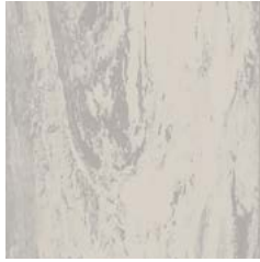
Polar Grey 9340 w/r 9340 NCS S 2002-Y50R LRV 54 ■ ■ +