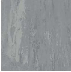
Slate Grey 9200 w/r 9200 NCS S 4000-N LRV 32 ■ ■ +