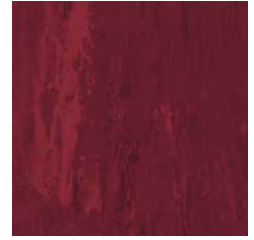
Black Cherry 8580 w/r 8580 NCS S 5030-R LRV 9