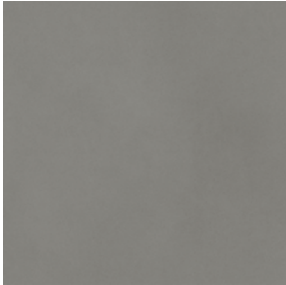
Cold Grey Concrete 2566 LRV 18