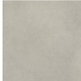
Light Grey Concrete 2567 LRV 34