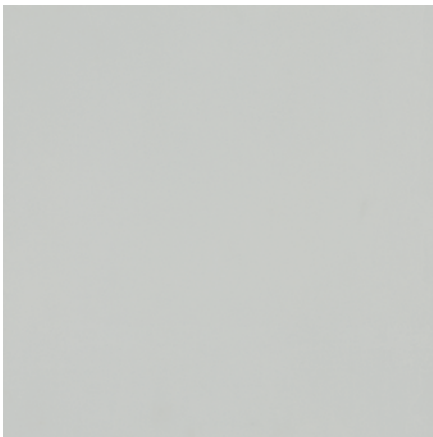
Light Mono 2579 LRV 51