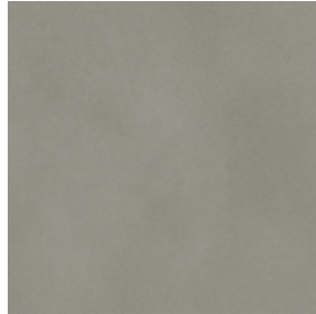
Warm Grey Concrete 2568 LRV 23