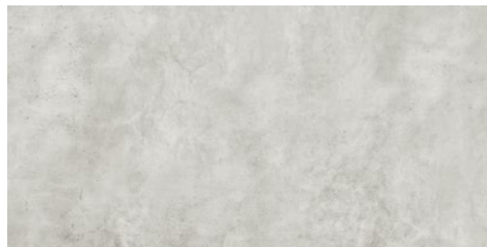
Soho Marble 2827